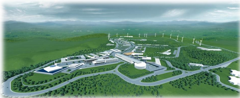
Resim-7: Köyceğiz Kampüsü