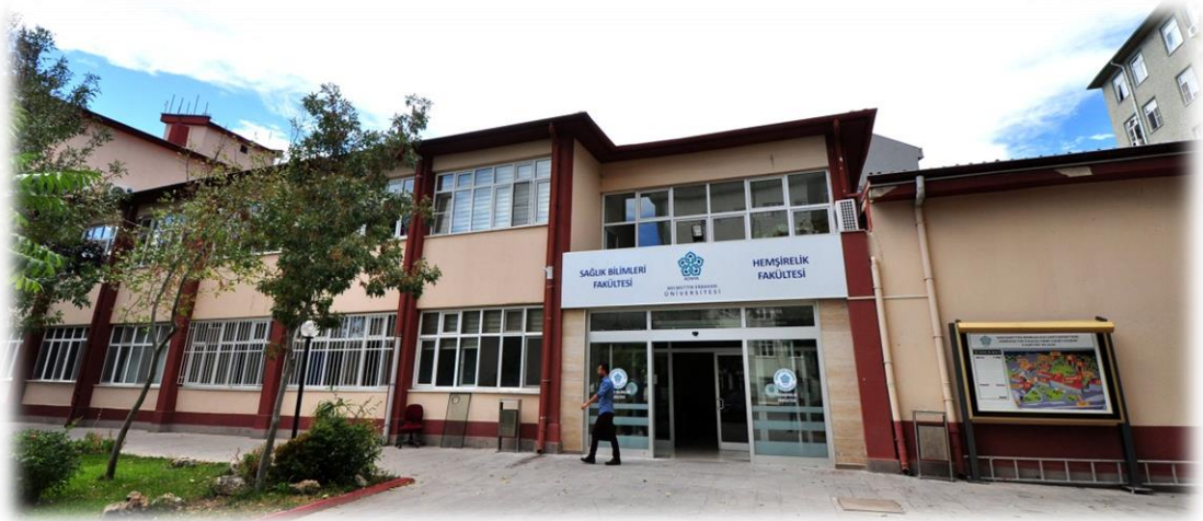
Resim-12: Sağlık Bilimleri Fakültesi