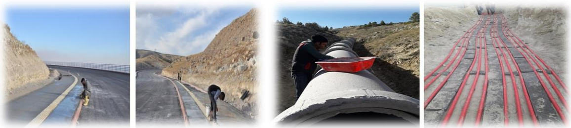
Resim-8: Kampüs Altyapısı