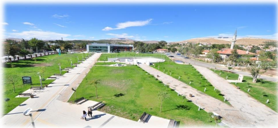
Resim-13: 15 Temmuz Kampüsü ve Güzel Sanatlar Fakültesi Onarım İşi