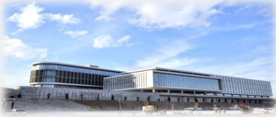
Resim-1,2: Sosyal ve Beşeri Bilimler Fakültesi Binası