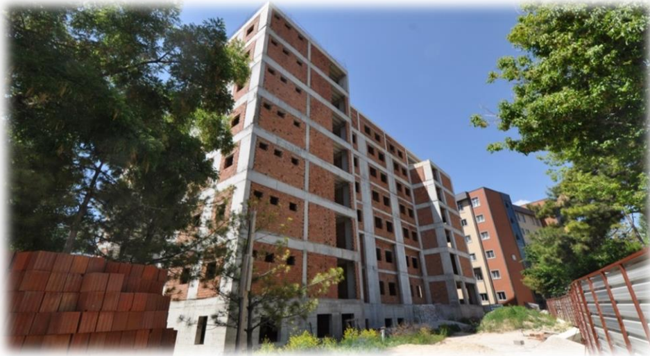
Resim-11: Diş Hekimliği Fakültesi Hastanesi