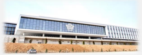
Resim-3,4: Mühendislik ve Mimarlık Fakültesi İdari ve Derslik Blokları