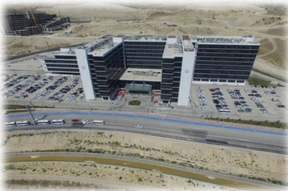
Resim-9,10: Meram Tıp Fakültesi Hastanesi