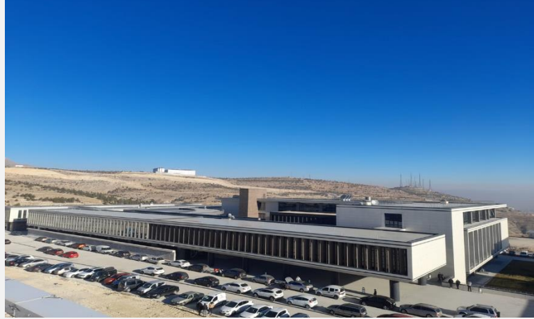
Resim 3: Mühendislik Fakültesi Laboratuvar Blokları