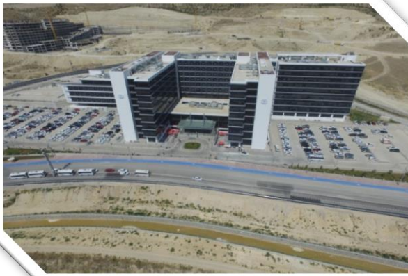
Resim 6-7: Meram Tıp Fakültesi Hastanesi Yeni Bina