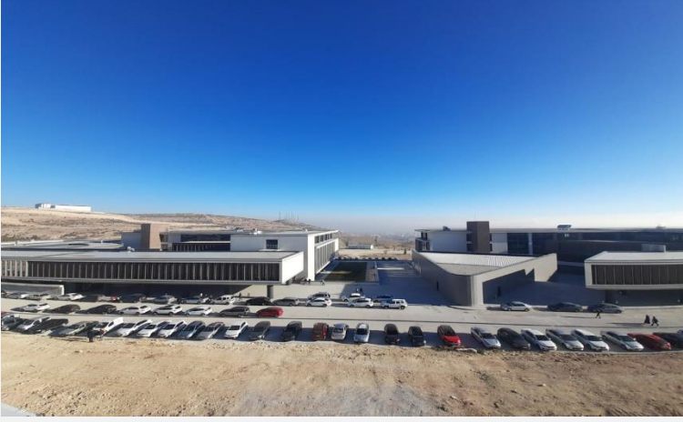
Resim 1-2: Mühendislik Fakültesi İdari ve Derslik Blokları